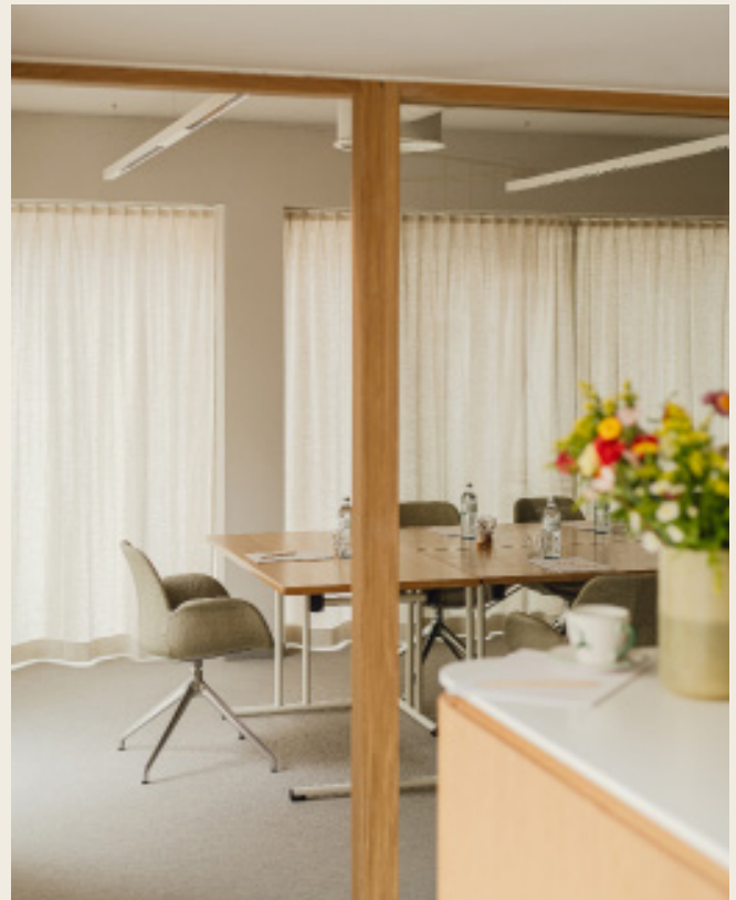
↳ S02 mit Empfangsraum